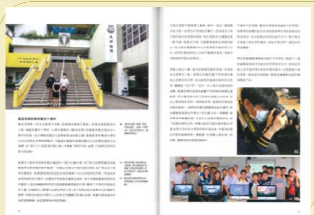
香港印藝學會主辦第三十二屆 香港印製大獎學校刊物金獎 刊於2022年8月號 《香港印藝學會月刊》