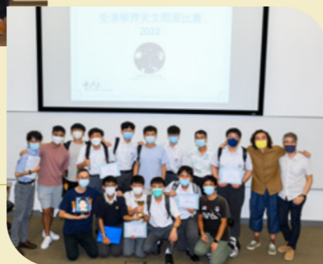
中文大學天文學會主辦 全港學界天文問答比賽 團體亞軍