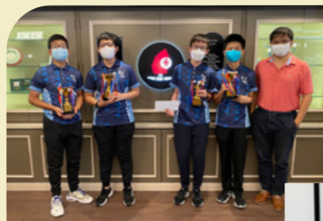
香港中學橋牌協會主辦 玫瑰盃2022季軍等 多個獎項