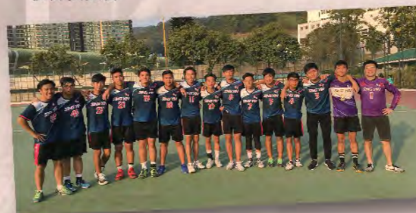
甲組手球隊勇奪學界比賽第二組別冠軍。

升學及就業輔導學會、聖言先鋒、聖言電台、聖言電視台、童軍、社區服務組、公益少年團、學生會、四社、聖言校報、舞台管理組、體育委員會